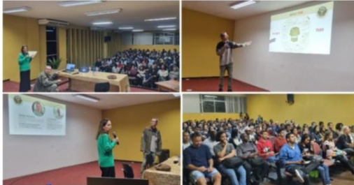
Workshop sobre sustentabilidade /Abertura do Projeto Integrador 2023.1